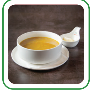
شورية ثمار البحر