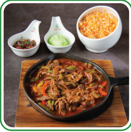
Steak Hawa Lebanon