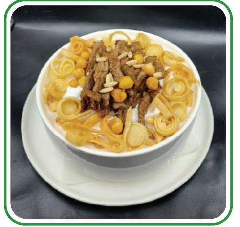
ستيك هوا لبنان